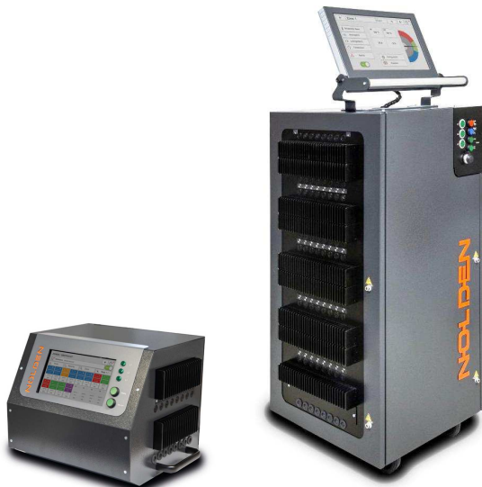
Abb.: NR8024 für 24 Zonen