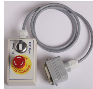
Abb.: Handbediengerät / NOT-AUS