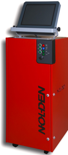
Abb.: NR7064 für 64 Zonen