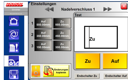
Abb.: Bildschirm für Handbetrieb / Test

Jedes Ventil kann einzeln im Testbetrieb AUF bzw. ZU gefahren werden, hierbei wird auch der Schaltzustand einer evtl. vorhandenen Lageerkennung angezeigt.