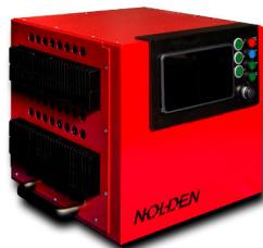
Abb.: NR8024 für 24 Zonen