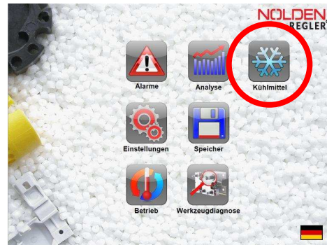
Kühlmittel-Überwachung auf dem „Homescreen“ des Regelgerätes

Folgende Anzeigearten können angewählt werden :