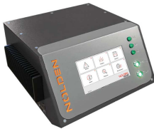
Abb.: NR8008-v3 mini für 8 Zonen