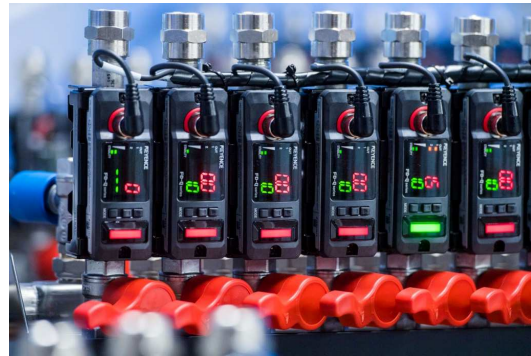
Intelligenter Kühlmittelverteiler System ORCA