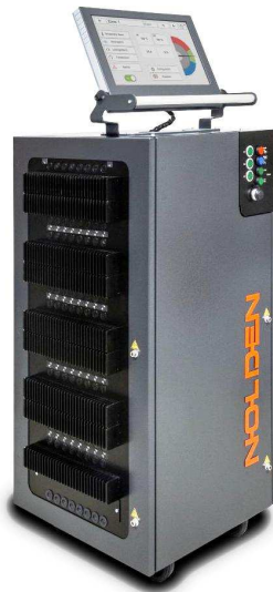
Abb.: NR7072-v3 für 72 Zonen