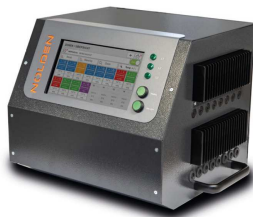
Abb.: NR8024-v23 für 24 Zonen