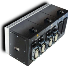
Abb.: Anbauregler NR8016